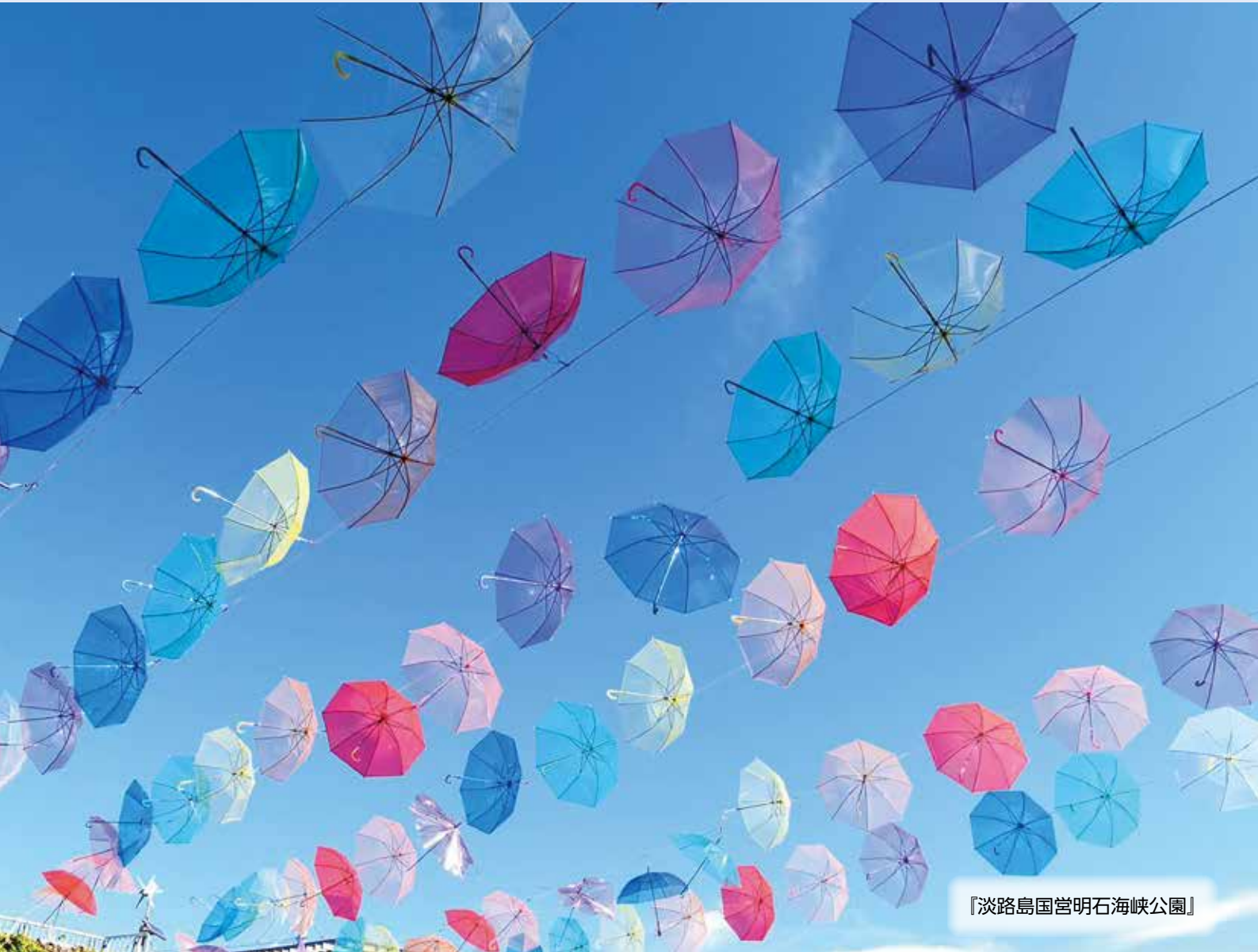
『淡路島国営明石海峡公園』