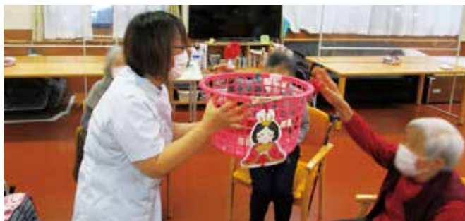
やまのベオレンジヒルズ ひな祭り