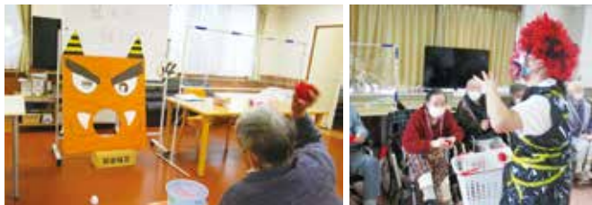
やまのベグリーンヒルズ 節分

やまのベグリーンヒルズ 2月の節分とオレンジヒルズ 3月のひな祭りのレクリエーションの様子です。グリーンヒルズでは赤鬼 VS 青鬼のチーム対抗玉入れゲームで、皆様元気に厄除けをされ春の訪れを待たれていました。