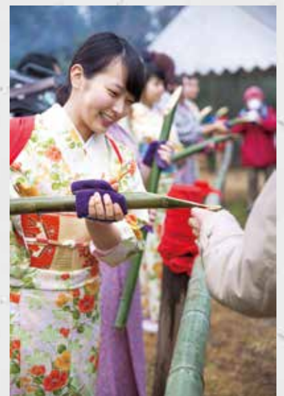
光仁会 癌封じ笹酒祭り