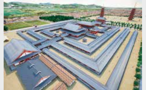
天平伽藍 CG 復元

このように堅固な伝統と少しの革新が共存する大安寺に、是非一度お参りいただけましたら幸いです。